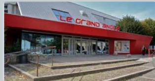
Animation / Sorties